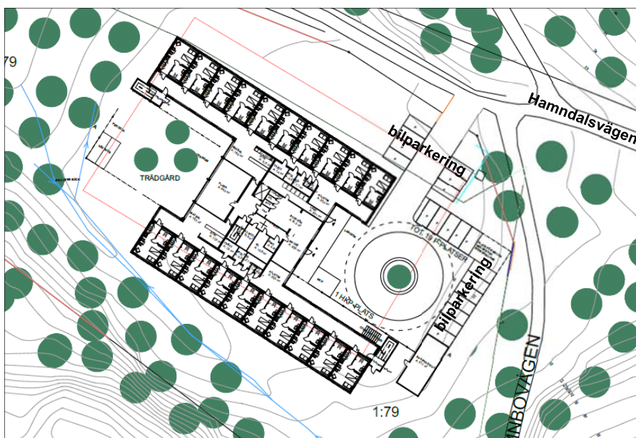
Situationsplan över planerad bebyggelse.